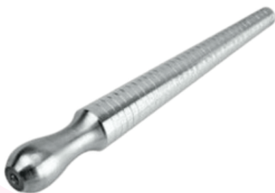
Instrumento medidor de anel.