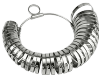
Aneleira; medidor de dedo.

Há duas formas principais de descobrir o tamanho de anéis e alianças: instrumento Medidor e Aneleira, encontrados em joalherias. O instrumento medidor utiliza anéis para checar o tamanho assim como nosso medidor, e com a aneleira descobre o tamanho seu dedo. Ambos instrumentos feitos de metal e padrão brasileiro.